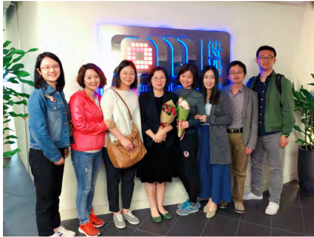
(临走前一日与Kitty和Dudu合影)

位都精心准备诚意满满，让我们每一天都收获颇丰。在研讨之余，老师们也随时为我们敞开办公室，欢迎我们随时提出问题。也正是由于他们的真诚与宽厚，让我们的城大之行温馨又难忘，让我们心安地融入了多友这个共同的大家庭。