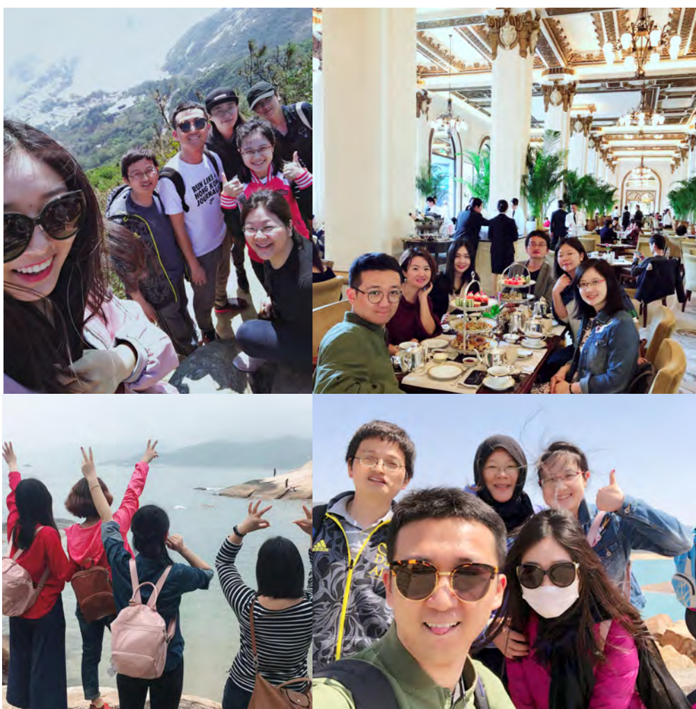
(很高兴，与你一路同行)

课题是要交的，生活也是要过的！在城大老师们的热情推荐下，餐叙小组的待完成事项中，先后添上了龙脊山、长洲岛、山顶缆车、东坝水库。小周充分发挥了导游的潜质，确定每一次的出行和线路；楚楚仍然是班长和采购小能手，负责所有的集体开销和账务明细。于是，我们一起挤上港铁，坐着小巴满香港“乱窜”，且行且看。爬过碎石的龙脊山，吹过石澳的海风，尝过长洲的海鲜，也品过半岛的下午茶。更是在三十度的香港，徒步十公里，在人迹罕至的山路上唱着歌聊着天，只为寻找那一方翡翠一般的水库。